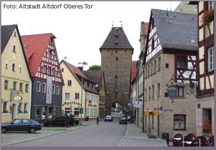
Foto: Altstadt Altdorf Oberes Tor